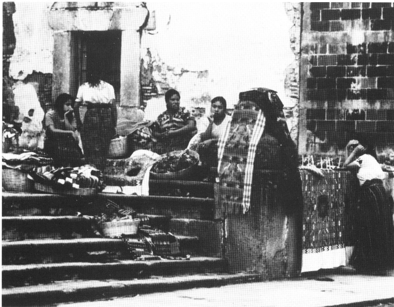
Una strada di Antigua, Guatemala (Paola Cocchi).

L'operazione da compiersi sugli uccelli, orrendamente seviziati, imbragati ed appesi ad un filo, ridotti a «richiami vivi» ed usati appunto come esca per altre catture massicce, viene così descritta dal volume Il capanno - metodo e tecnica della caccia con i richiami pubblicato dall'Editoriale Olimpia: «A tutti gli uccelli di richiamo si tolgono le penne. Il giorno della tradizione per la delicata operazione è il 24 giugno: San Giovanni. Si entra nella stanza oscura di buon mattino, con la sedia e un aiutante, si prendono uno ad uno gli uccelli dalle singole gabbie (...) L'operatore, seduto, prende delicatamente con la sinistra ogni uccello e con la destra toglie ad una ad una le remiganti esterne (tre o quattro) delle due ali e tutta la coda; inoltre qualche piccolo ciuffetto di piume leggere (...) Occorre molta attenzione e molta delicatezza: qualche volta è avvenuto al sottoscritto, che pure ha tanti anni di pratica, di sentirsi