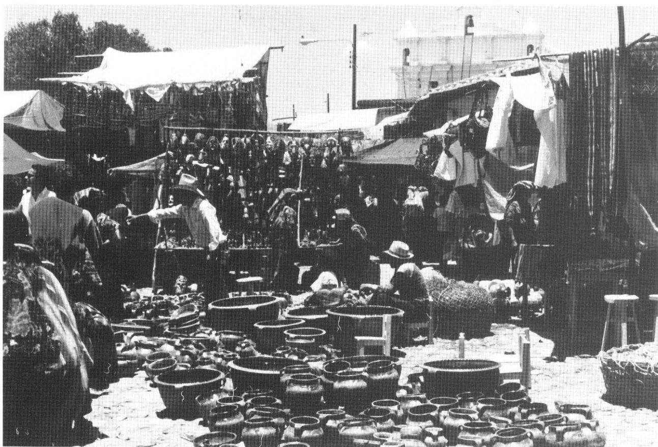
Venditori a Chichicastenango, Guatemala (Paola Cocchi).

Ma il risultato – e lo diciamo proprio perché noi siamo fra la piccola schiera degli assidui lettori del Manifesto, che ci appare, nonostante i limiti, l'unico quotidiano oggi leggibile – è francamente disastroso. Il disco è inascoltabile, presentandosi all'orecchio come un misto di zuccherosità alla «Zecchino d'oro» e di risacchatura di pessima disco music , il tutto malcondito da insensati interventi sonori di quel gruppo di jazzisti italiani (Colombo, Fresu, Nini, ecc.) che non cessano – coordinati da Bruno Tommaso, insopportabile teorizzatore di un sincretismo tanto vuoto quanto accademico – di annoiarsi con la loro poetica di una via «italiana» al jazz poggiante sulle basi di una matrice «mediterranea» (si veda, a questo proposito, il bell'intervento di Marco Tartarini sul numero 54, settembre '89, di «Luci»).