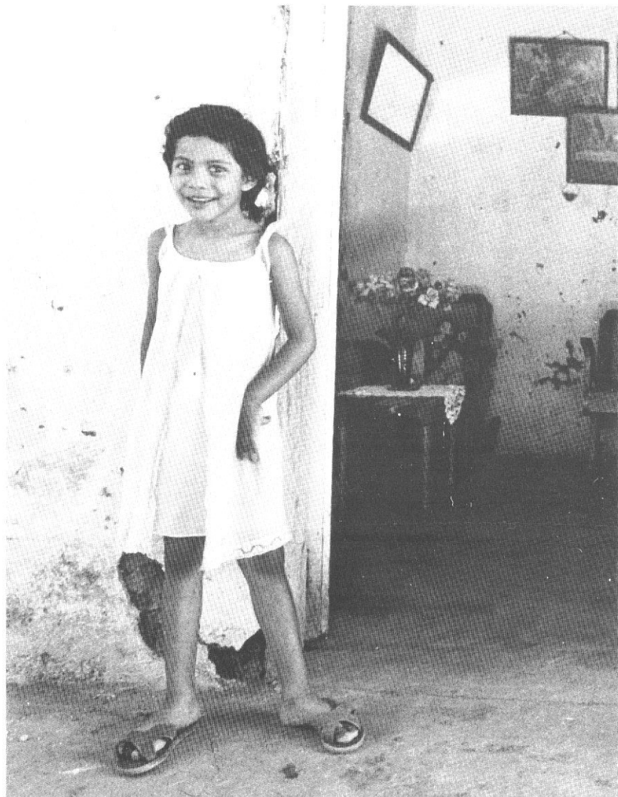
Una casa di contadini a Matagalpa, Nicaragua (Luca Gavagna).

● MANTRA RECORDS , via degli Etruschi 4, 00185 Roma. Alberto Gabrieli (Direttore Artistico), Sante Cal-