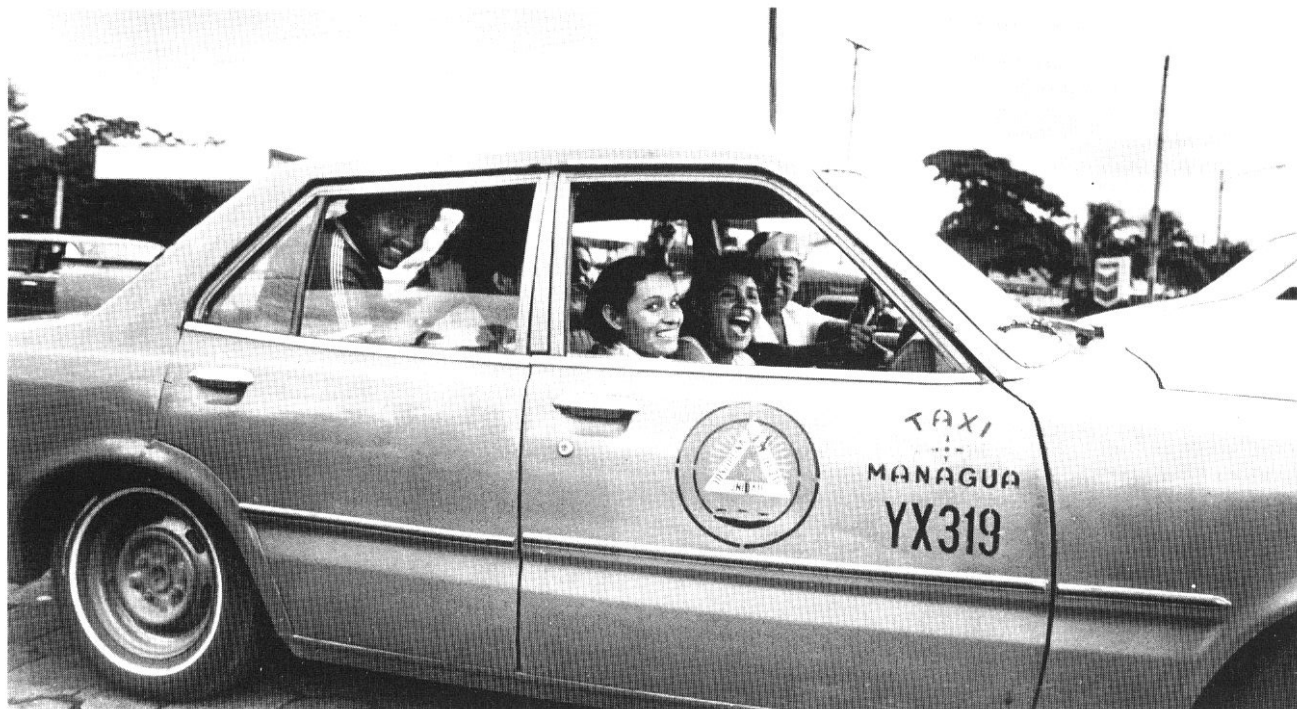
Un taxi collettivo per le strade del centro di Managua, Nicaragua.

La presenza del mito diventa presenza dell'imprevisto, il tentativo di fuga che diventa vano. Mentre la condanna della storia incombe nelle ragioni esterne della nostra esistenza il riflesso medesimo di quella condanna, che altri non è se non la propria casa, il corpo amato, l'odore dei vicoli, in altre parole il macerarsi mortale del presente, diventa paradossalmente liberazione da essa. Emarginazione, condizione di omosessualità, amore della caducità del presente, in altre parole e con una parola