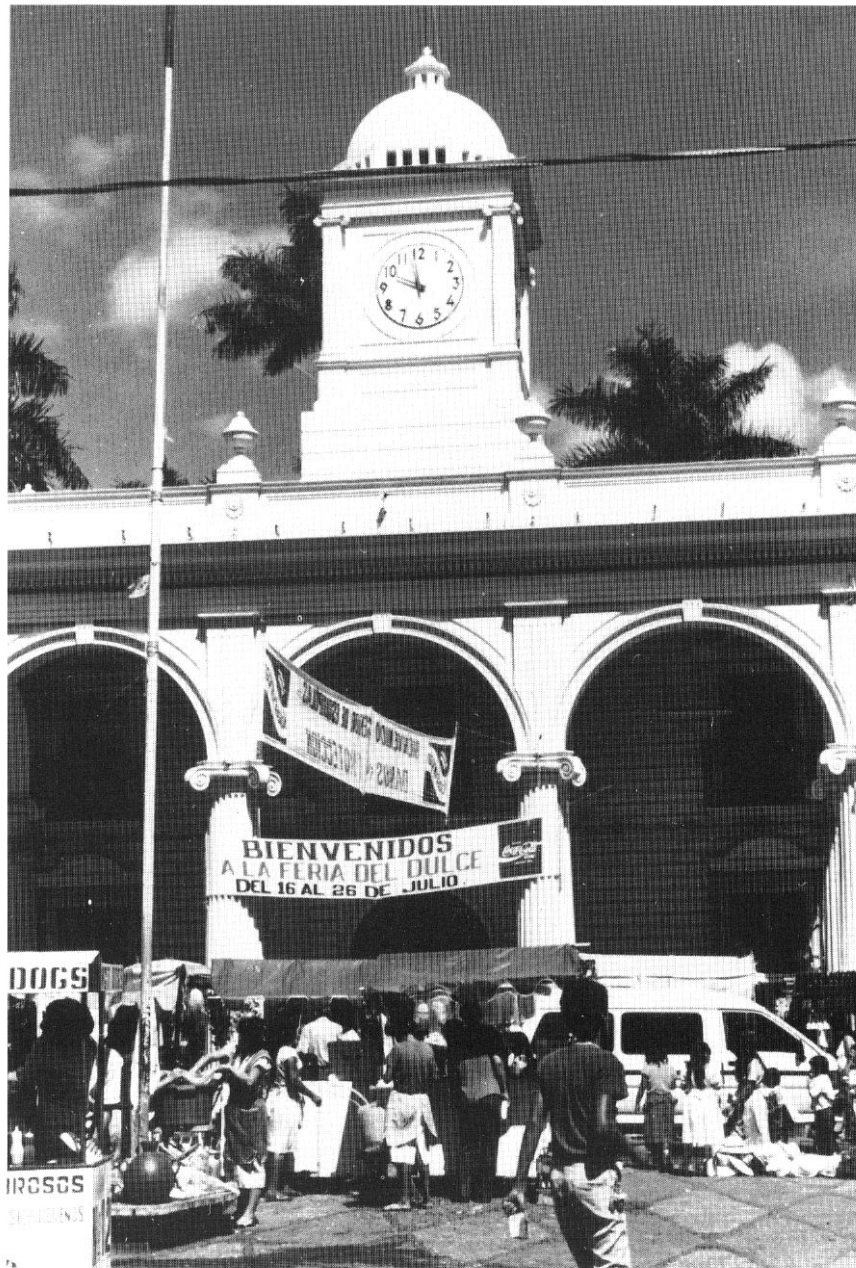
Festa patronale a Santa Ana, Salvador (Paola Cocchi).

E questo risultato fa ben sperare nella mentalità delle generazioni future, affinché che possano finalmente liberarsi dai tanti preconcetti che permeano il mondo della danza.