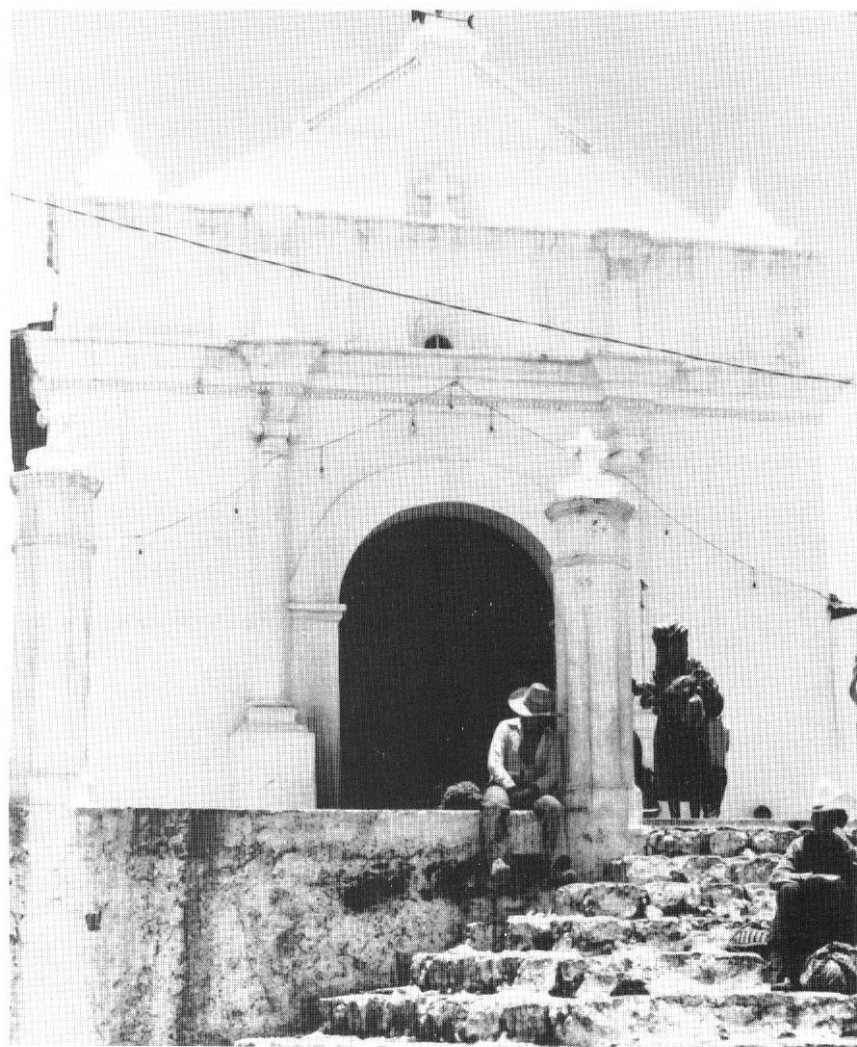
Chichicastenango, Guatemala (Paola Cocchi).

realtà locali. Per questo sono moderatamente ottimista sullo sviluppo successivo di una strategia che, superando il federalismo delle idee, si configuri come strategia espressamente e consapevolmente unitaria.