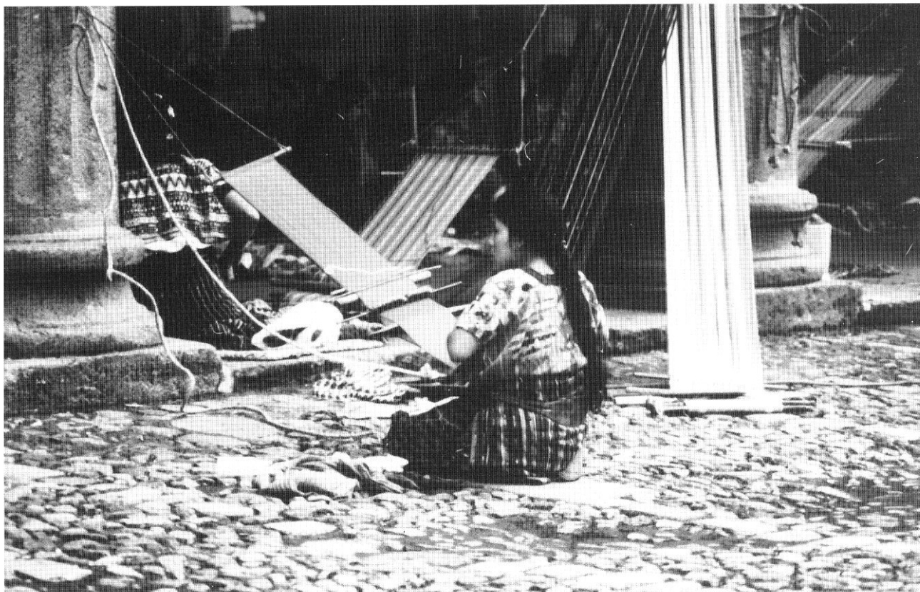
Tessitrice ad Antigua, Guatemala (Paola Cocchi).

«Michele Perfetti / che abita tra il segno e il sogno / e fa delle parole un paesag-