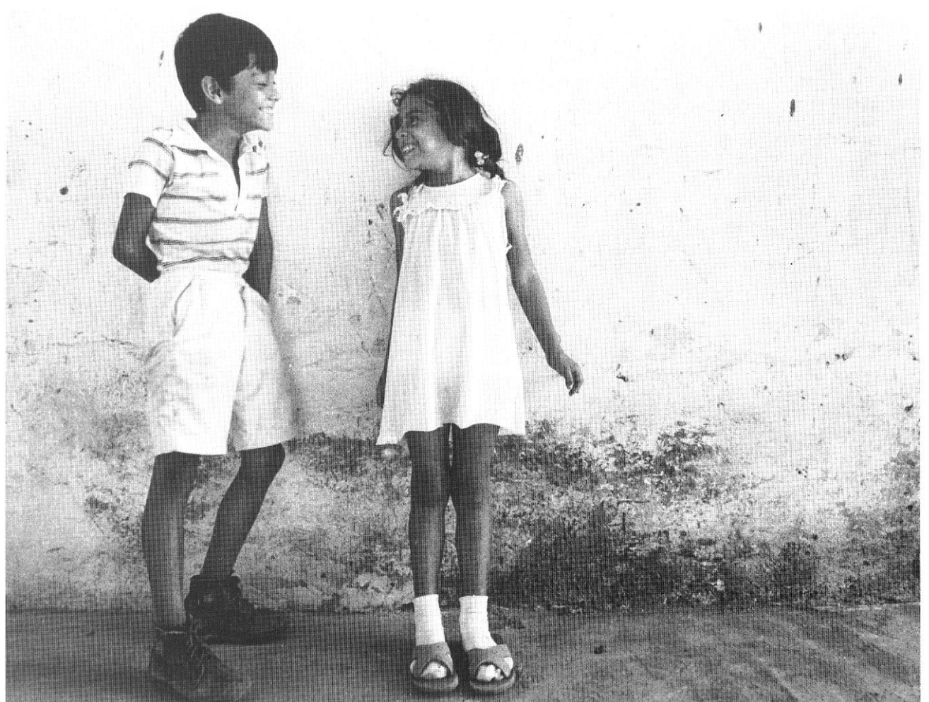
Ragazzini a Matagalpa, Nicaragua (Luca Gavagna).

Ho incontrato dopo alcuni mesi lo stesso ragazzo il quale mi ha raccontato che