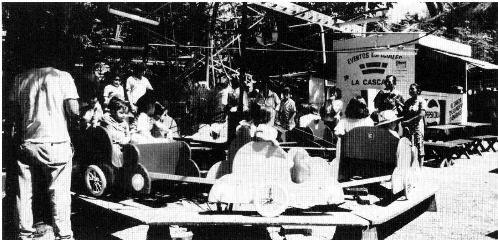
Giostra di legno a Santa Ana, Salvador (Paola Cocchi).