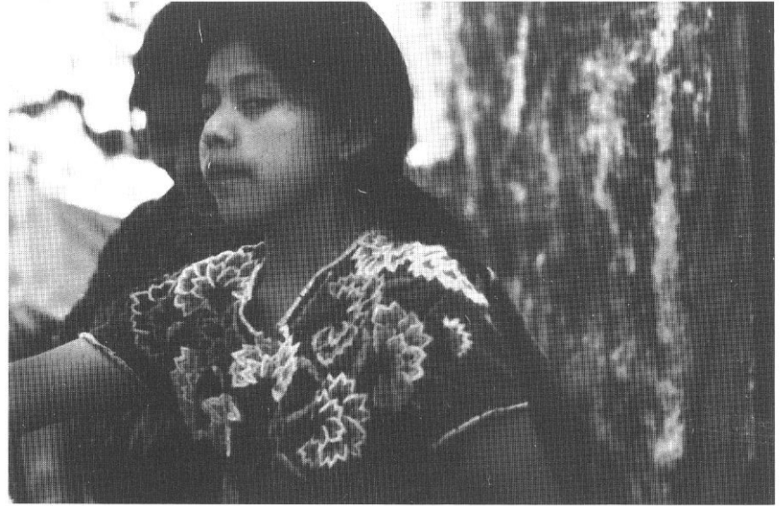
Bambine ad Antigua, Guatemala (Paola Cocchi).