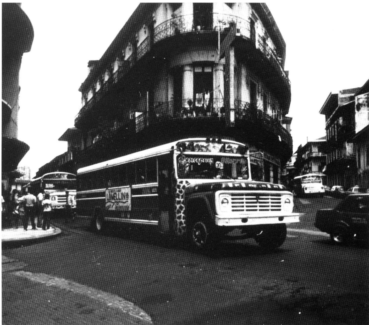
Una strada del centro di Panama City, Panama (Paola Cocchi).

sulle abitudini delle streghe. Ignoranza, fanatismo, sessuofobia hanno sempre occultato la vera identità delle streghe, le quali probabilmente rappresentavano la sopravvivenza di culti religiosi precristiani, ricchi di riti agrari cui si erano sovrapposti nel tempo credenze e culti cristiani, facendo così confondere le antiche divinità dei campi, dei boschi e delle fonti con Satana. La tesi di un culto pagano conservatosi attraverso i secoli nelle zone più decentrate – e quindi più difficili da assoggettare al culto ufficiale – è nella sostanza plausibile, anche perché è proprio in queste zone «marginali» che si è verificata una maggiore diffusione della stregoneria. Resta però indubbio che la repressione di queste «isole» di pratiche pagane ed incomprensibili, va inquadrata nel contesto generale di spirito «quaresimale» trionfante a fine '500, in cui sessuofobia, antifemminismo, censura ecclesiastica, repressione di pratiche e credenze folkloristiche, caccia alle streghe, non sono che aspetti diversi e complementari di un'epoca di paura e di intolleranza.