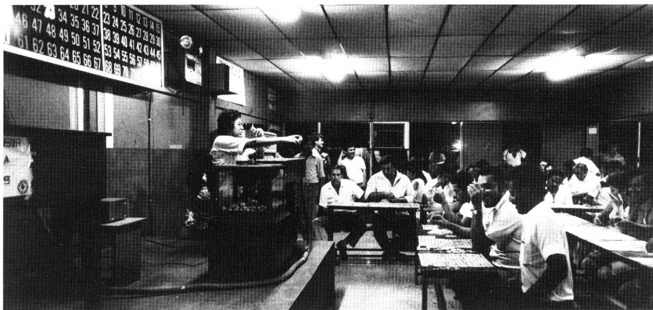
La tombola organizzata dalla Croce Rossa a Managua, Nicaragua (Luca Gavagna).

Ma ciò che è più evidente, nella visione di insieme dello spettacolo è la mancanza di un lessico teatrale da parte di Herzog, il quale, affrontando un libretto orribile e una brutta partitura, ammette candidamente di non conoscere il mondo della lirica, di avere visto soltanto tre opere in vita sua e forse, pen-